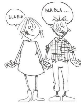
gesprek met collega