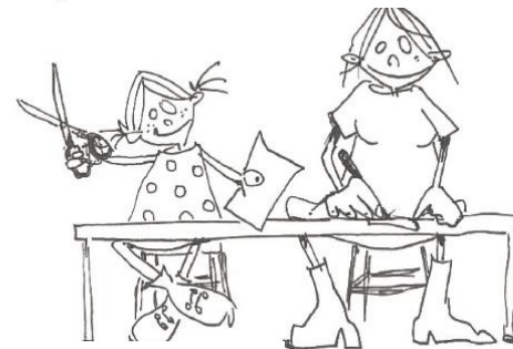
knutselen of kleuren