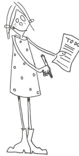
to do lijst maken