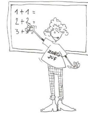
collega vervangt je voor een korte tijd