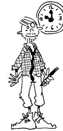
pauze = pauze