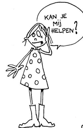
durf hulp vragen