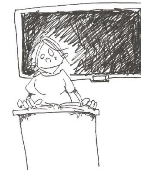
tijdens de pauze in de klas blijven