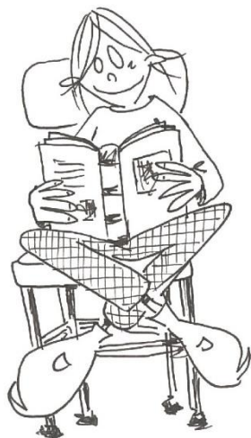
lezen of voorlezen