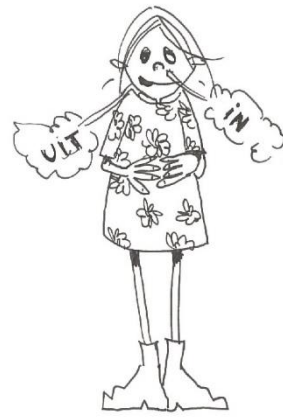
diep ademen/ ademhalingspelletjes