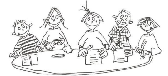
tijdens de pauze in de leraarskamer zitten