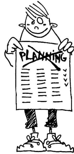
durf planning aanpassen durf veranderen van activiteit/les