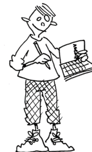
plan niet teveel zorg voor haalbare deadlines