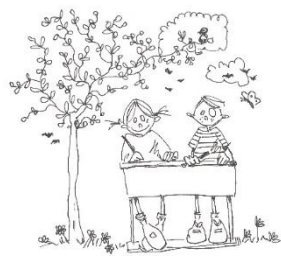
buiten les geven