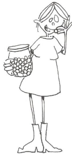
iets lekker eten