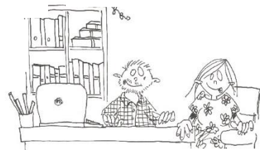
erkenning van de directie